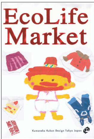
コラージュ・ポスター (ハンドメイド) サイズ:A3~A1 (予定) 価格:未定 (相談)