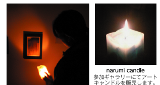
ギャラリー閲覧風景

K's Gallery 銀座1-5-1第三太陽ビル6F ks-g.cool.ne.jp TEL&FAX 03-5159-0809